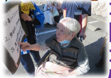
▲うおずみ祭でも早口言葉に挑戦