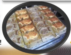
▲模擬店は行列ができるにぎわい！