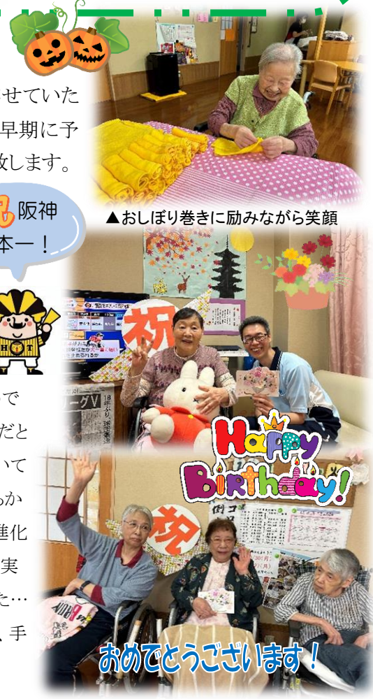
▲おしぼり巻きに励みながら笑顔

特別固いフランスパンを食べたらアゴが疲れてしまって…大食漢の私めでも、それだけで結構満腹感が得られました。やっぱりよく噛むのはいいことだと実感します。一方、ランニングシューズは今まで固めのソールを好んで履いていたのですが、柔らかめのを履いてみたらいい感じで走れました。柔らかいソールは沈み込むだけという固定観念を覆す反発力。最近シューズの進化は著しいです。さて、小紙にて不定期にとんちクイズを出題していますが、実は出題者である私めが殆ど解けないのです。あっ、カミングアウトしちゃった…どなたかほぐしていただけませんか、このカチカチ頭。でも、うおずみ祭は、手堅く毎年開催できるといいですね。皆様、本当にありがとうございました。