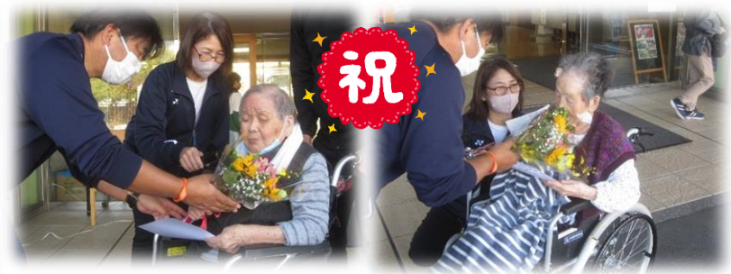
▲百寿超えの方へ花束を贈呈するセレモニーを行いました

10月27日(金)午後、季節の前進を加速させるかのようなスコール、雷と強い風に見舞われました。