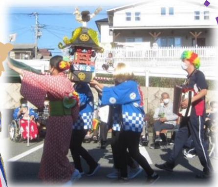
▲うおずみ祭では、行事委員による「うおずみマン・ショー」を披露しました