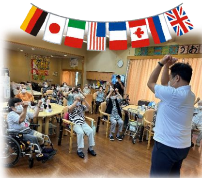
▲理学療法士による体操教室(DSにて)

16年目にして13回目となりますうおずみ祭。調べてみると、直近の開催となった第12回祭を知る方はご入居者70名様の中で15名様のみ。多くの方が初参加ということです。…年ひと昔といいますが、4年の月日を経て、ご面会やボランティアの方々の行き来がなくなったことに慣れてしまったご入居者・職員共々へ、いい刺激を与えてくれることでしょう。只今準備奮闘中。楽しみましょう!