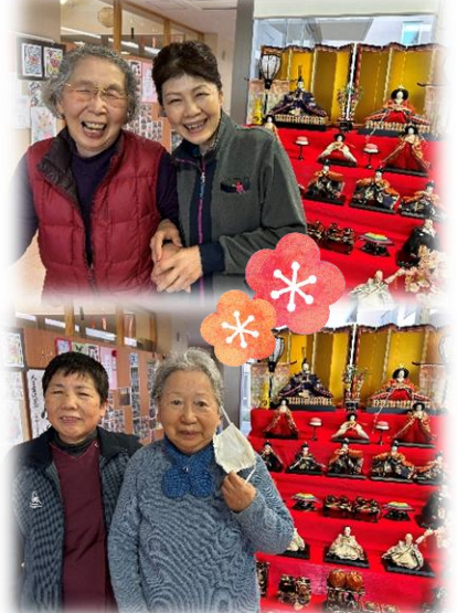
▼ひな祭りに迎える卒寿! サンキュー

美味しかった後は、雪洞に灯をつけて歌いましょう。「今日は楽しいひな祭り」記念撮影もバッチリ決まって、おてんとサンサン、ごきげんサン。