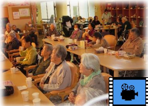
▲映画鑑賞 ▼花壇の前で(デイサービス)