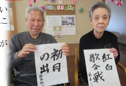
▲書き納め ▼花に囲まれ誕生日！