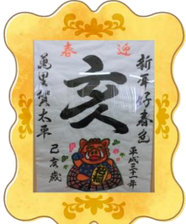
▲ペン習字・合田先生作