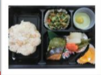
← 4/3(火) 花見弁当Ⅰ(炊き込みご飯)