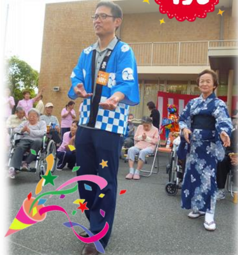
▲青葉台自治会の方々とともに盆踊り! ▼魚住東中吹奏楽部 (ともに10周年記念祭にて)

これからも、特別養護老人ホームうおずみに皆様の変わらぬご理解とご支援を賜りますようお願い申し上げます。