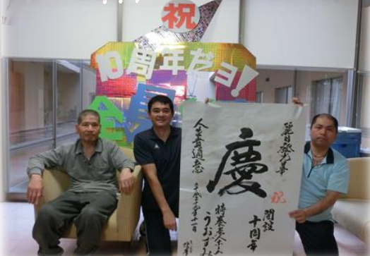
▲ペン習字・合田先生より、10周年の書をいただきました▼不在者投票(衆院選/10月19日)