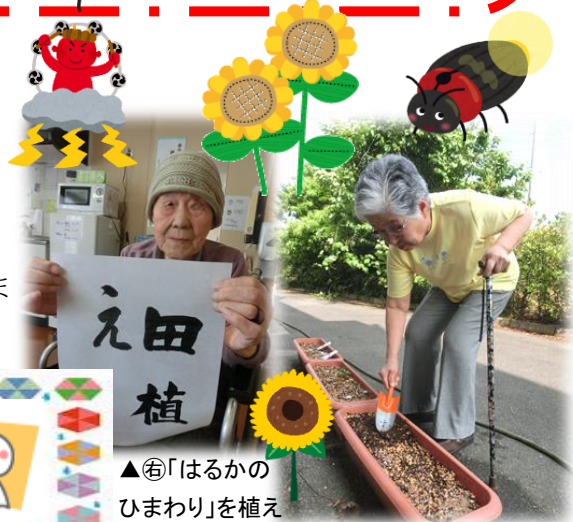
▲⑥「はるかのひまわり」を植えました(5/26)。開花が待ち遠しい！