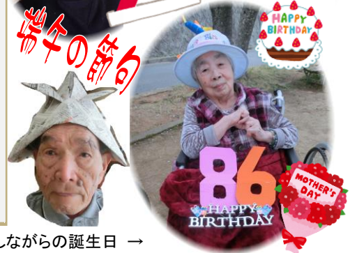
花見しながらの誕生日 → (4/10、青葉台公園) ▼五月人形を飾りました(4/10)