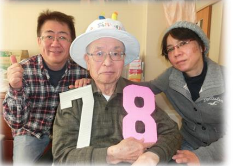
▲Happyバースデー!(1/22. 5丁目) ▼二人羽織でメイクを(1/23 音楽療法)

銀行のATMにご入居者様のお金を預け入れたら、印字されずに通帳が戻ってきました。お金は戻ってきません。大切なお金が失くなってしまった!と慌ててインターホンで職員さん呼びました。しばし待たされる間に私は怒り心頭。そこへ現れたのは美人行員でした。「すぐ調べて参ります」プロの営業スマイルで対応してくれた彼女に、鬼の形相は綻ぶばかり。結果、ATMのインク切れだったことが判明し、ホッと一息。「申し訳ございませんでした」とティッシュをもらった時、自分の表情がすごく険しかったことに気づき超赤面、恥ずかしや...なんと勝手な、本能むき出しの浅はかさに猛反省。以後気を付けますです、ハイ。