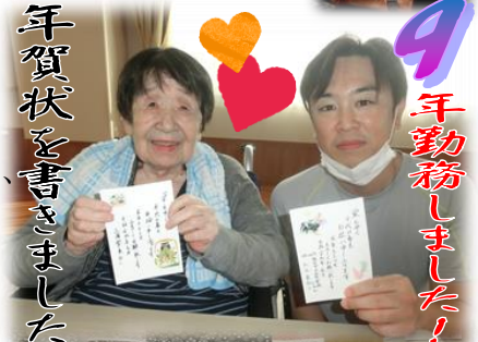
年賀状を書きました