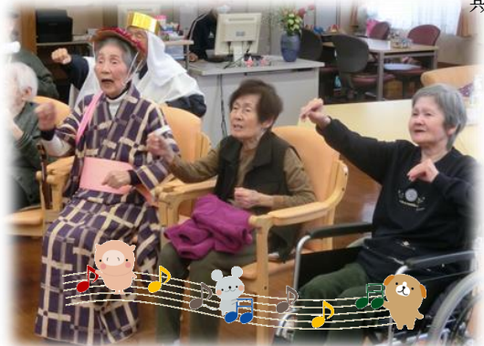
色々な道具を使ってアクティブに奏でます!