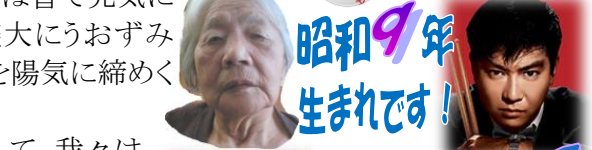
昭和9年生まれです!