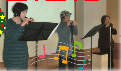
▲おなじみ! スウィートポテトによるオカリナ演奏会(11/29)