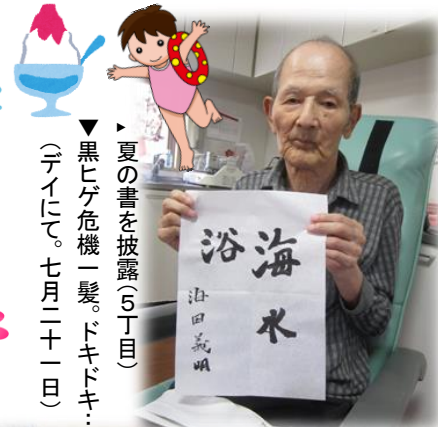
▼夏の書を披露(5丁目) 黒ヒゲ危機一髪、ドキドキ... (デイにて。七月二十一日)

ふと目にしたテレビ番組で、阪神・藤浪投手のサインボールが当たる懸賞へ応募したところ、見事お宝をゲットしました。これまで当選には無縁だったので、ついに自分にも運が向いてきたかと、さらなる幸運へ期待を馳せております。勢いによって、車や宝くじも当ててみよう!なんて調子に乗ったりして。おっと、タナボタばかりをアテにしているはいけません。一生懸命頑張っている者にこそ、幸運は巡り来るもの。生きていればツライことは沢山あるけれど、いつも上を向いて歩きます。サインボールが見てるから。藤浪君、我が家でボールを飾って応援しているから、早く20勝投手になってね。うおずみも頑張ります。最多勝のボールも、ちょうだい!