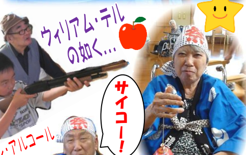
ウィリアム・テルの如く...