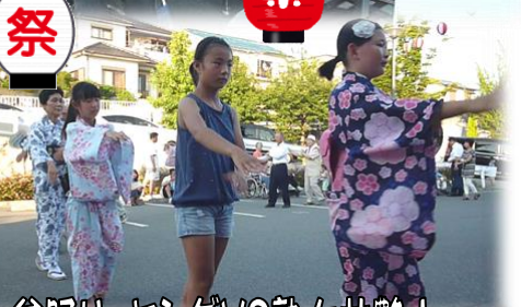
盆踊り、ヤングVS熟女共艶!