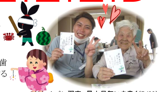
▲ペン習字。暑中見舞いを書く(7/28)