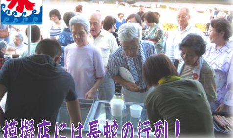
模擬店には長蛇の行列!