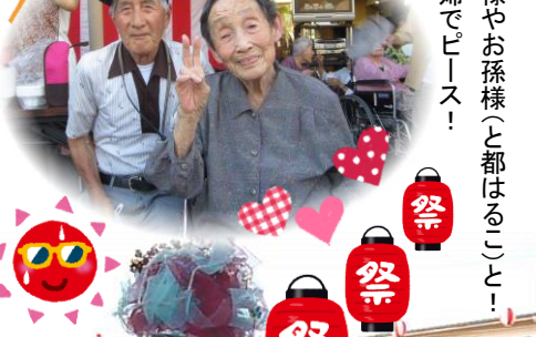
▲娘様やお孫様(と都はるこ)夫婦でピース!