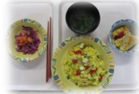
▲2/20のランチはパエリア

過去に、クリスマスバイキングでも提供させていただいたこのパエリア。米どころとして知られるスペイン東部バレンシア地方発祥の、米と野菜、魚介類、肉などを炊き込んだ料理で、世界的に人気があります。パエジェーラと呼ばれる専用のパエリア鍋(両側に取り手のある平底の浅くて丸いフライパン)で、たっぷりの具を炒めて、米と水、それにサフラン(アヤメ科の多年草およびそのめしべを乾燥させた黄色い香辛料)を加えて炊き上げます。たくさん入った貝の食感が、食べ応えを盛り上げ、ボリュームを求める貴兄も大満足のランチタイムでした。