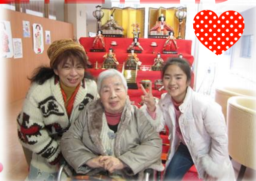
▲三世代官女でパチリ(2/21)