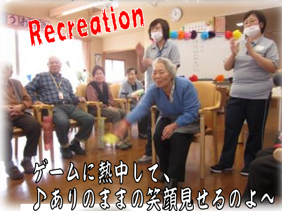
ゲームに熱中して、♪ありのままの笑顔見せるのよ〜