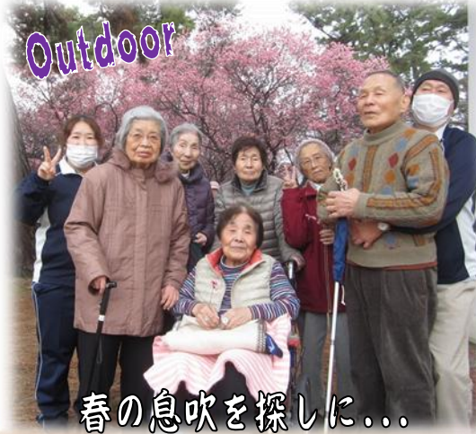
春の息吹を探しに...