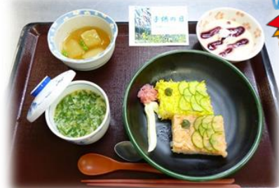
⑤鯉のぼり寿司 (5月5日昼食)