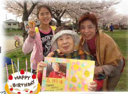
(左)花見会場での誕生日会(6丁目)