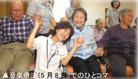
▲音楽療法(5月8日)でのひとコマ