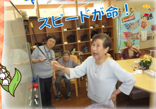
▲新企画！数字指ししゲーム中(デイにて)