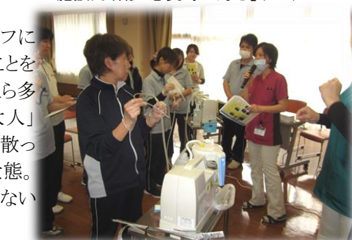
▼施設内研修「急変時の対応」(5/1)