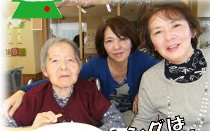
バイキングは 今年も大盛況!