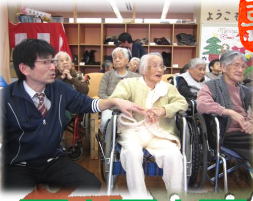
▼クリスマス会の合間にちょっと一息