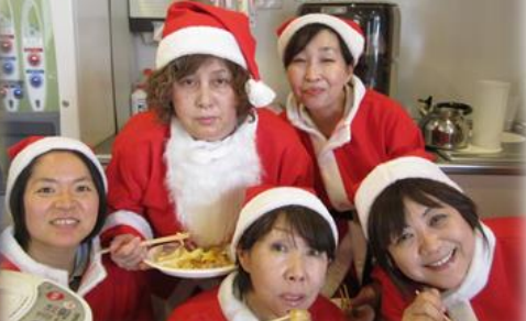
▲突如現れた美女サンタ五人衆(3・5丁目合同クリスマス会会場にて/12月14日)