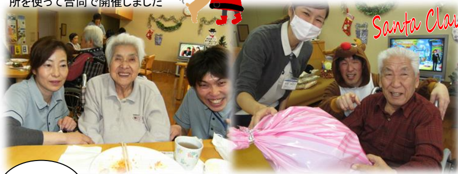
⑥プレゼントをゲット!