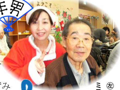
⑥6丁目に登場したサンタは弾き語り ミニコンサート トをプレゼント!

食後は2頭のトナカイによる不器用な余興や、たくさんのサンタからのプレゼ ント贈呈などでお楽しみいただきました。毎年この日には多数の方々がお越し 下さって大盛況になり、嬉しい限りです。そんな、サンタの姿でないサン タも合わせると、夥しい人数のサンタに恵まれたことになりますね。