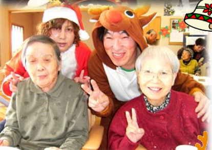
▲3・5 丁目は、デイサービスの場 所を使って合同で開催しました

貴方にとって、サンタクロースは何人 いますか?よく頑張った時のご褒美と して二人、いやいやもっと欲張って四人 くらい…ちょっと待てよ、サンタって世界 にただ一人では?とんでもない!うおずみ にはサンタが異常発生しています。そんな 噂を聞きつけ、現場へ急行した月刊うおずみ 取材班。そこには驚愕の光景が…!!噂に違 わず、見渡す限りサンタ、サンタ、サンタの王 国のようにありませんか。