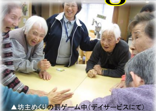
▲坊主めくりの罰ゲーム中(デイサービスにて)