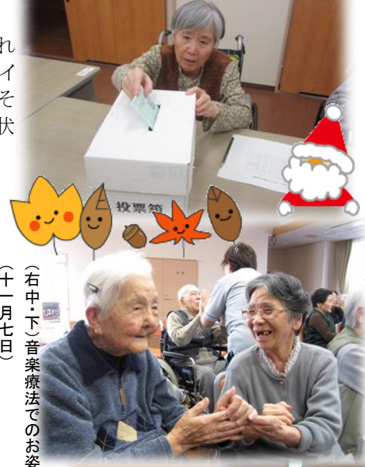
(右中・下)音楽療法でのお姿 (十一月七日)