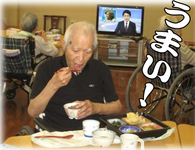
▼盛りつけも鮮やか！ 目にも舌にも美味しい