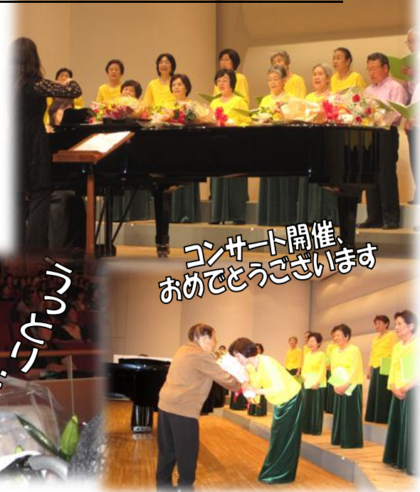
コンサート開催、おめでとうございます

うおずみ開設以来、毎月欠かさず来所されて素敵な混声コーラスを聞かせて下さっている、青葉台うたうサークルの皆様。これからも、うおずみで美しい歌声を響かせ続けて下さい！