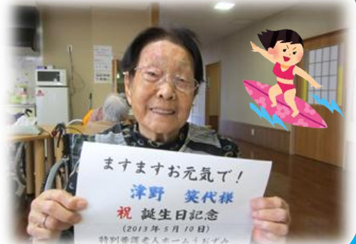
▼5月10日、誕生日の笑顔

私は今春うおずみに入居したのですが、それまでは高知県幡多郡大月町に長く暮らしていました。高知といえば、何とんでも坂本龍馬。その銅像がある桂浜をはさむようにして東に室戸岬、西に足摺岬があります。大月町は足摺の近くです。西へ向けばすぐ九州。南側は太平洋。太平洋の荒波を利用して、サーフィンが盛んです。香川や愛媛からも多くのサーファーが車に乗ってやってきます。同じ波でも泡の出る波はダメ。私は泳ぎが得意ですが、波乗りは見るだけ。でも、楽しくサーフィンできる波を見極める眼力も、自然に身につきました。故郷の海、大好きです。