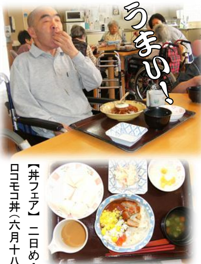
【井フエア】二日め・ ロコモ井(六月十八日)

貴方は白いご飯派？それとも混ぜご飯派？古来、日本の上流階級の食事は、主食であるご飯とおかずが別々に配膳され、それを一箸ごとに口に運ぶという様子を基本としている事から、今でも主食におかずを乗せることを忌避する人も多です。その後、江戸で新しい食べ方として大流行したのが井。江戸は職人気質な人や短気な人が多い都。そのため、蕎麦もぶっかけ(のちのかけそば)にし、他のおかずも飯の上にぶっかけたといひます。このように、おかずと御飯を一緒にまとめた井物は、今でも時間のかからない便利な食事として、好まれているのです。6月は3日間に渡り、井物を提供させていただきました。さて、ご感想は？