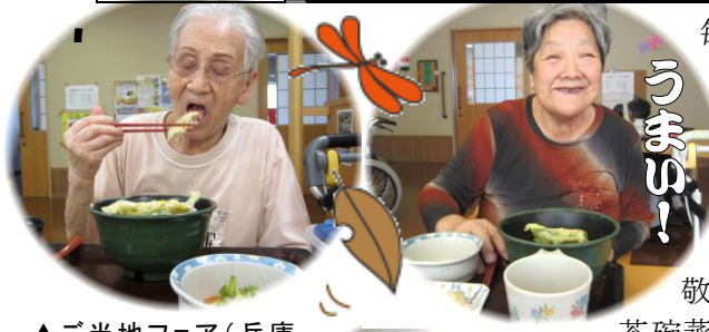
▲ご当地フェア(兵庫県)・穴子天井(9/25) ▶敬老の日・豪華赤飯・天ぷらランチ(9/17)

毎月、47都道府県の名産を「ご当地フェア」と銘打ってお届けして参りましたが、意外や意外、初登場となったのは、我が地元・兵庫県です。この日は、天ぷらにした穴子をふっくらご飯にのせて、ソフトな食感をお楽しみいただきました。