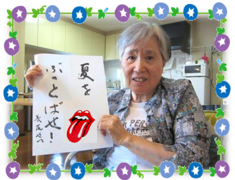
▼アイスクリームをセルフサービスで (7月24日、デイサービスにて)

英国のローリングストーンズのヒット曲に「夜をぶっとばせ!」という歌がありますが、それになぞらえて、今年は「夏をぶっとばせ!」元気に、いい汗かいて、疾走しましょう。でも、涼やかに!!