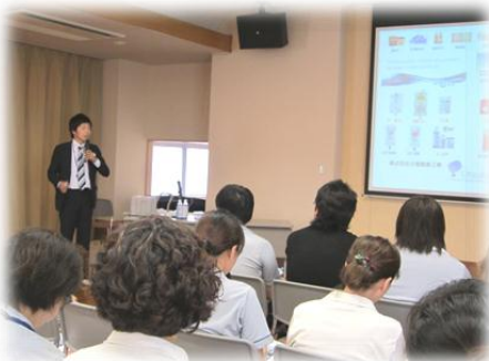
▲脱水・熱中症予防のための水分補給について、施設内研修を実施(7月12日)