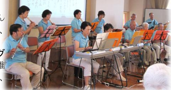
▲あかねが丘学園・器楽クラブによるバンド演奏&コーラス(8月2日)