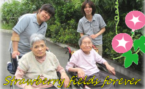
Strawberry fields forever