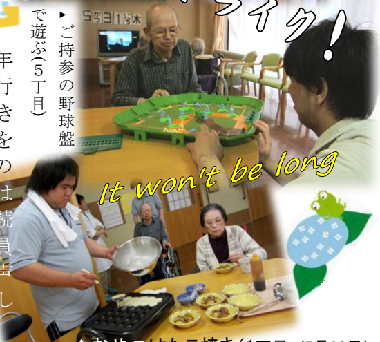
▲おやつはたこ焼き(1丁目/5月30日)