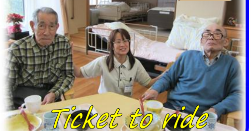
Ticket to ride