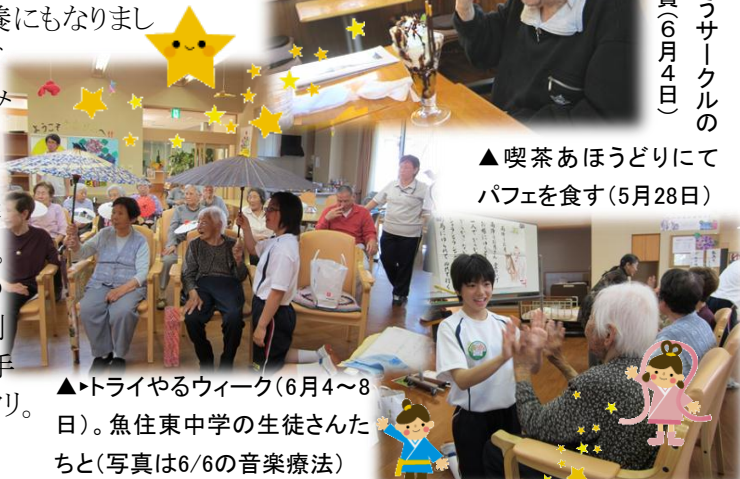
▲トライやるウィーク(6月4～8日)。魚住東中学の生徒さんたちと(写真は6/6の音楽療法)