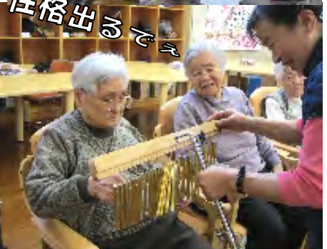
▲ツリーチャイムで桜吹雪を表現(音楽療法)