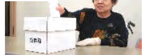
▲明石市長選 ▼大正琴(あかねが丘学園)