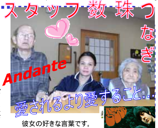
彼女の好きな言葉です。

【誕生日】9月20日(乙女座) 【血液型】G型(笑) 【子供】3人 【好きなもの】掃除、一人の時間 【趣味】買い物でポイント貯めたり、割引券を集めたり...ささやかなマイブームです。 【紹介します】長躯を利用してゆっくり歩を進めるのが、彼女の特徴です。働く者は皆、濃密な業務に後押しされてつい早足になるもの。そこへ彼女がマツリとした空気を注入し、ご入居者の心をそっと落ち着かせてくれます。「早よ来てよ～」の声も、そのスーパー・マイルドな笑顔で包んでしまう要領良さを押さえた才女なのです。そう！癒されるより癒したいんです(K)