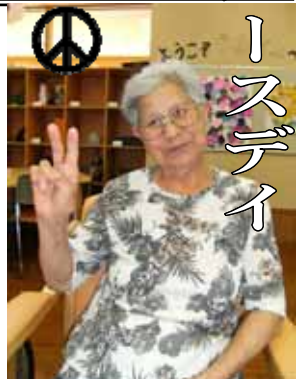
8月が誕生日のおふたり