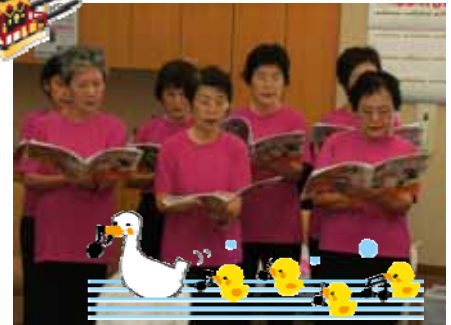
魚住東コミセン高齢者大学コーラス部の皆様によるコンサート(8月27日)

かねてからの懸案事項でありました自転車置場(建物西側)の屋根が、近日中に設置される予定です。完成後、小紙面にてお知らせ致します。