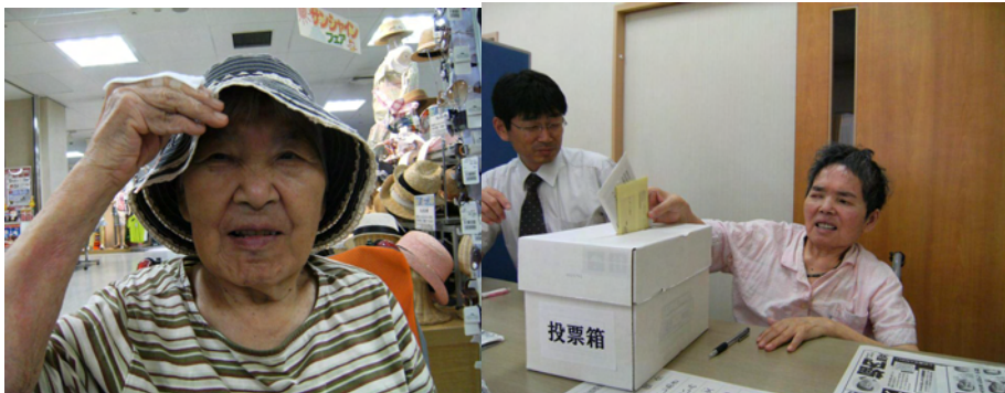
▲ファッション・トレンドをリサーチ(6/23) ▲うおずみにて参議院選挙不在者投票(7/6)

お体が不自由なために一人で外出ができなくても、店で欲しいものを選ぶことができるなら付き添えばいいし、選挙なら不在者投票という方法をとれます。スタッフの人数やご入居者の体力面を鑑みると、今回(6月に6丁目の方々)のような企画は多く実現できませんが、お元気な頃の生活に一歩でも近づけるお手伝いを、ユニットケアという手法を使い、今後もさせていただきたいと思っております。プラス思考で、楽しい2010年夏の思い出を、一緒につくっていきましょう!