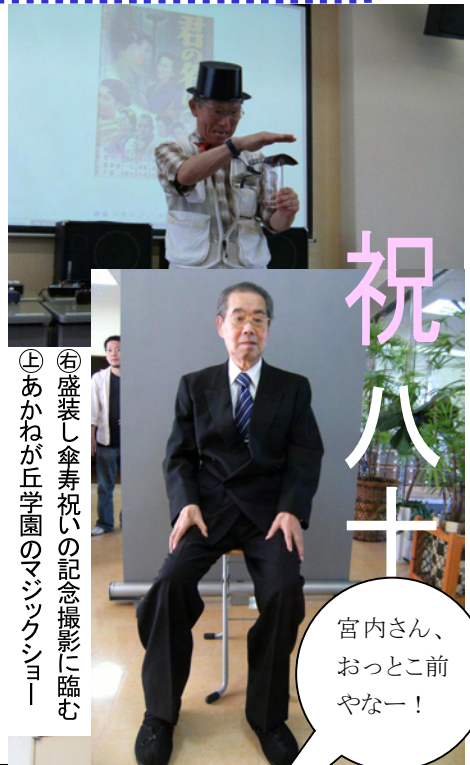
⑥盛装し傘寿祝いの記念撮影に臨む ⑦あかねが丘学園のマジックショー