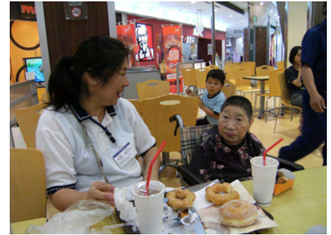
▲ミスドでおやつタイム(カナートにて。6/23)

我々の仕事は、ご入居者のQOLを高めてゆくこと。忘れかけていたIADLを、できる範囲で使うことによって笑顔へ導けたなら、介護職冥利に尽きます。