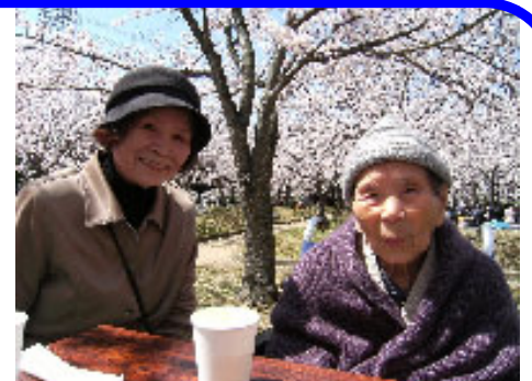
▲4月8日(木)、さくらの森公園にて