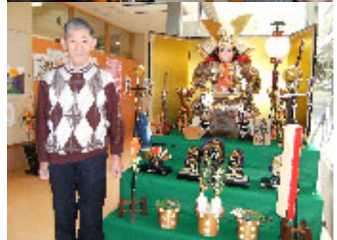
▲豪華な五月人形を飾りました。是非一見を