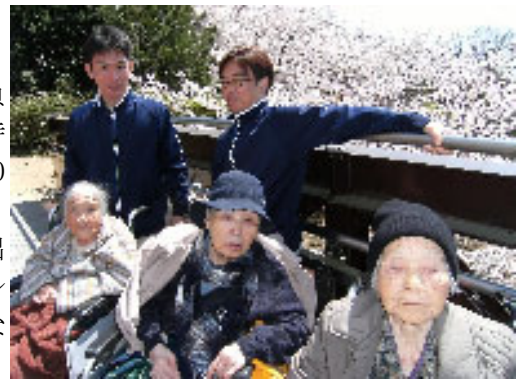
▲メンズ・スタッフで、宿直をがんばっています (こちらも、4月8日(木) さくらの森公園にて)