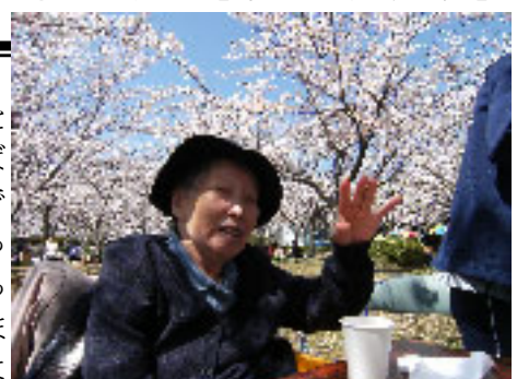
▲満開の桜をバックに、快心の笑顔