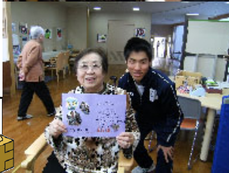
1月、誕生日記念(デイサービスにて) ㊤実習生と ㊦仲良しお二人でご利用中