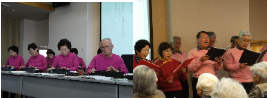
▲1/29、あかねが丘学園の皆様

そして2月1日、青葉台うたうサークル&グリークラブの皆様が、素敵な男女混声コーラスを届けて下さいました。懐メロ・童謡をはじめ、初披露の曲や無伴奏での歌を含めた全13曲をご熱唱の後、アンコールにもお応え下さり、またまたサービス満点のコンサートになりました。歌は世につれ、世は歌につれ…音楽って本当にいいものですね。音楽の生演奏・歌唱に直面すると、日常とは一味も二味も違った表情を見せて下さる利用者様が非常に多いです。今後も、温かい音楽とお元氣なお姿を届け続けて下さい。うおずみの願いです。