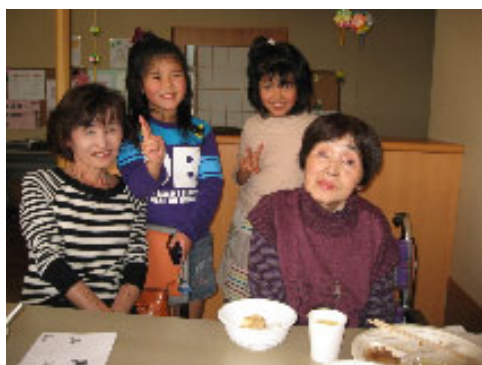
◎かわいなお子様たちもご来場下さいました