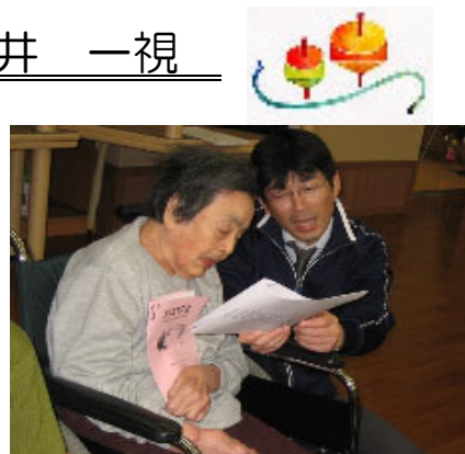
▲12月、クリスマス会にて