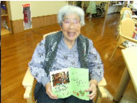
④ デイサービス開設当初から元気に通所されているご利用者様（十一月、誕生会にて）