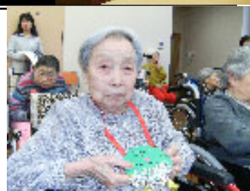
▲ 誕生日を祝う(12/8 クリスマス・コンサートにて)