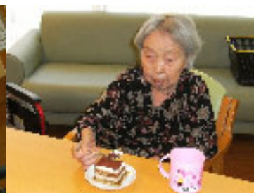
▲ケーキを召し上がっていただきました(8月24日、5丁目にて)