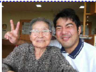
7月より勤務しております