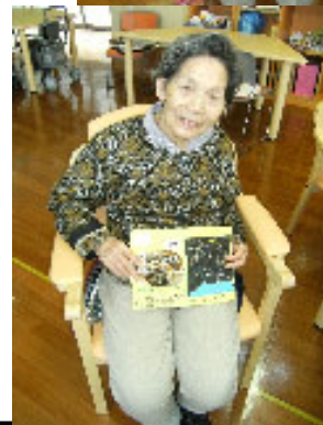
8月、誕生会にて(デイサービス)

9月4日(金) 《 魚住東コミセン高齢者大学コーラス部 》 13:30～ デイサービス 9月7日(金) 《 青葉台うたうサークル&グリークラブ 》 13:30～ 地域交流室 9月10日(木) 《 髪や 》 訪問理美容サービス 9月16日(水) 《 あかねが丘学園/たんぼぼ26 》 コーラス 14:00～ (地) 9月25日(金) 《 音楽療法 》 林先生 13:30～ (デ) 10月7日(水) 《 髪や 》 訪問理美容サービス (※10・11月は水曜に行います)