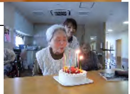
▲誕生会でのスナップ (上・下とも)