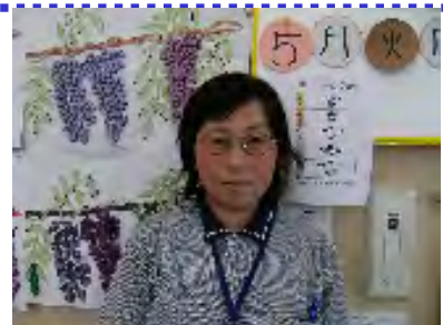
スタッフが1名増えました