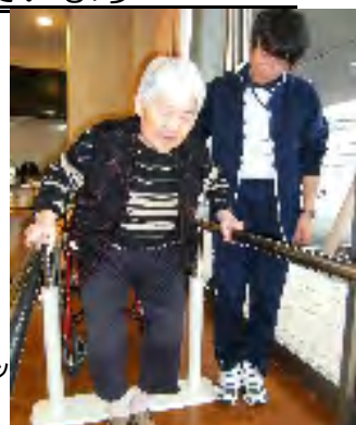
【右上】平行棒での歩行訓練 【右下】ベッド上での関節稼動域訓練 【下】マイクロ

内容は ～ 歩行訓練(平行棒や杖を使って、あるいは施設内外の散歩等)、立ち上がり・立位保持訓練、車椅子自走訓練、筋力強化(足の上げ下ろし、プーリーを使っての腕力訓練)、関節稼動域訓練(プラットホーム上、ベッド上等にて)、ホットパック、マイクロ ～ と様々です。綿密なリハビリ実施計画のもとに行っていますが、個々の生活や体調を考慮して、柔軟に曜日や時刻を変更することがあるのも強みです。意欲の旺盛な方が多く、自主的にリハビリ室にやって来る方もあります。皆様お元気に頑張っておられますよ。