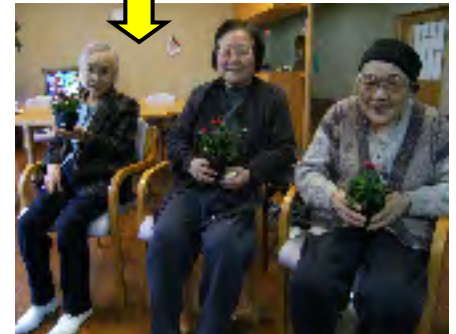
▲鉢植えの花を手にポーズ