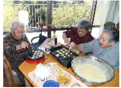
▲「ワイワイ言いながらクッキングするの また楽し

2月18日たこ焼きの鉄板を使って、皆様とともに丸いカステラを焼きました。そこはさすがにたこ焼きの鉄板。見た目はまるでタコヤキ…ソースをかけて青のりをのせたい気分でしたが、ほおばるとスイートな洋菓子の食感と美味。最近おやつを手作りする機会が増えています。今後もどんどんやっていきたいと思ひます。