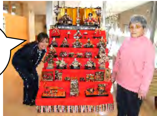
袖振り合うも多生の縁… 出会いは宝です