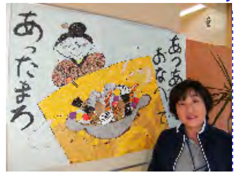
▲自らデザインしたちぎり絵の前で(うおずみのアイデア・ウーマンです)

【ひとこと】 人生の先輩である利用者様の歩んでこられた経験などのお話を聞かせていただき、自分の甘さに反省させられる日々です。ある本の中で「利用者様に笑顔でいてもらおうと思ったら、まずはスタッフが楽しく生き活きと働けるようにすることが重要なのだ」と。まだまだ未熟ですが、頑張りたいと思います。