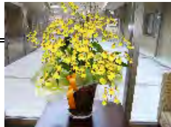
▲お祝いの花をいただきました

1年が経ち、ご入居者・職員ともに数名の入れ替わりがありました。これまで大きな感染症や事故等なく、施設経営も順調に歩を進めております。これも、ひとえに御家族や地域の方々、他事業所様等の支えの賜物と、感謝の意に堪えません。皆様との絆を守り、うおずみをより暖かな「家」とするため、さらなる精進を続けていく所存でございます。何卒今後も皆様の暖かいご指導・ご鞭撻を賜りますよう、心よりお願い申し上げます。