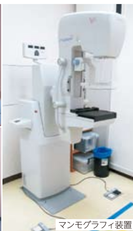
マンモグラフィ装置

MRI装置や血管造影装置をはじめ、その他充実した多様な装置を備えて、各診療科のオーダーに答えるようにしておりますが、装置の充実と撮影技術の向上だけでなく、皆様を検査のために出来るだけお待たせしないような、待ち時間の短縮をはじめ、気配りが行き届いた医療を目指しています。