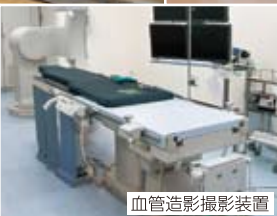
血管造影撮影装置