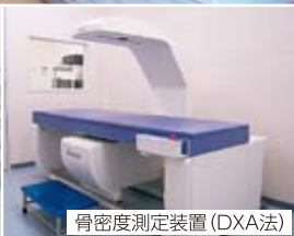
骨密度測定装置(DXA法)