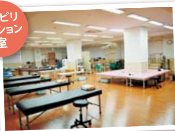
リハビリ テーション 室